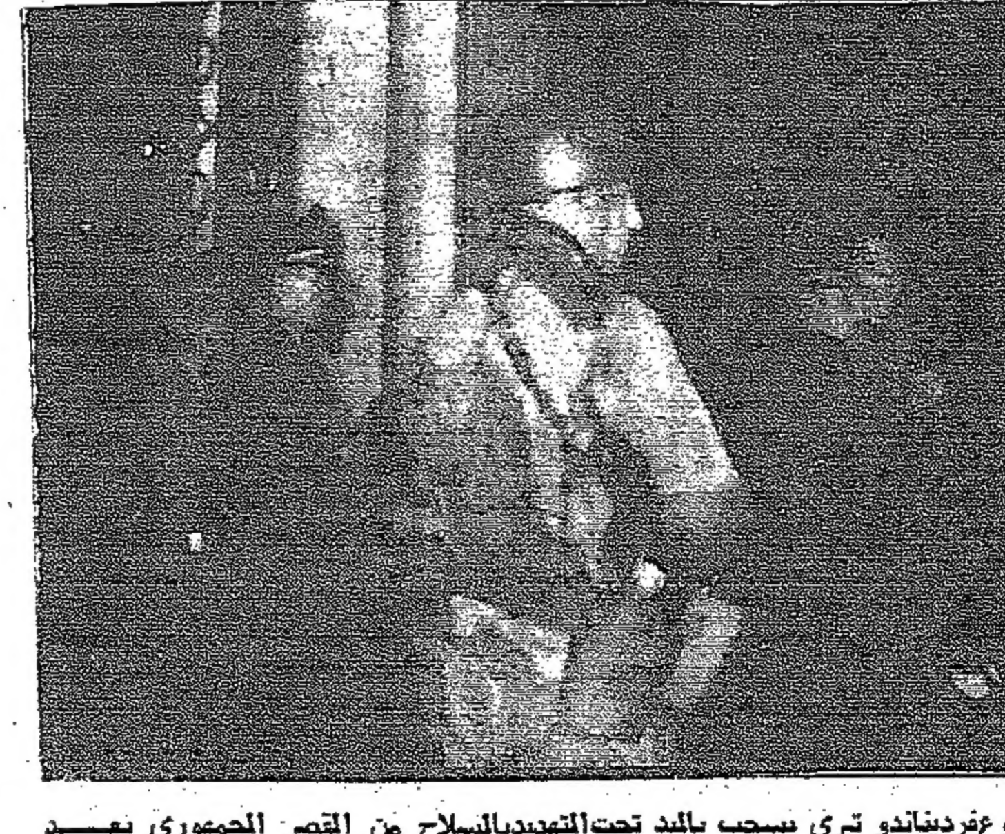
رئيس جمهورية بيرو المخلوع غروميكو تيري يسحب باليد تحت التهديد بالاسلح من القصر الجمهوري بعد الانقلاب العسكري في بيرو ( صور خاصة بالدستور من اليونانديبرس )

في القدس ومدن الضفة الغربية القدس - رويتر - قالت صحيفة « معارف » ان الكنيسة الارثوذكسية الروسية في اسرائيل قامت بحملة لوضع دعا على الكنيسة الروسية « البيضاء » في البلدة القديمة من القدس والضفة الغربية المحتلة من الاردن . واذعت الصحيفة ان هذه الخطوة المجازية هي بمثابة « اعتراف واقعي » البيقية على صفحة ٦ عمود ٦